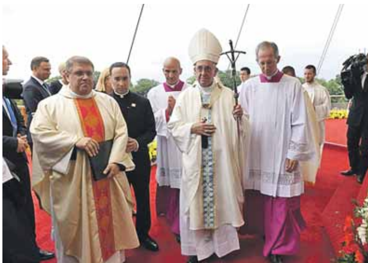
Papież Franciszek na Jasnej Górze 2016 r.

sobie w drodze do zbawienia. Piąty, ostatni, jest jeszcze z nami, za rok będzie zdawał maturę... Wiemy, że dzięki wierze, którą bez naszych zasług dostaliśmy od Pana Boga, jesteśmy szczęśliwi mimo wielu trudnych przeżyć, jesteśmy pewni, że w tym pielgrzymowaniu wytrwamy, bo ona nas podtrzymuje...”