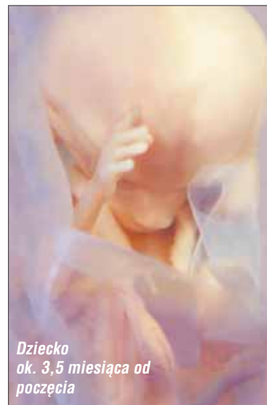
Dziecko ok. 3,5 miesiąca od poczęcia