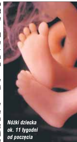
Nóżki dziecka ok. 11 tygodni od poczęcia

prezes Polskiego Stowarzyszenia Obrońców Życia Człowieka