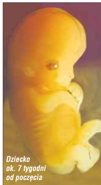
Dziecko ok. 7 tygodni od poczęcia

Św. Jan Paweł II nauczał, że każdy z nas ma bronić życia. Bronimy życia modlitwą, ale także podejmując konkretne, apo-