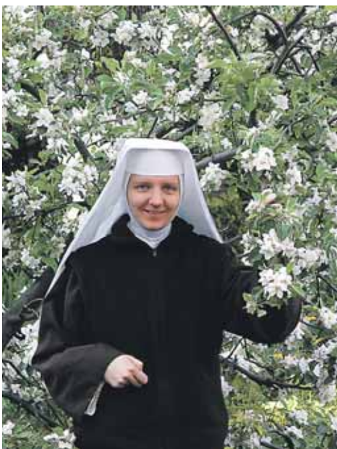
Siostry Bernardynki w Krakowie

ewangelicznym radykalizmem, które przybliżają Chrystusa bliźnim, które przybliżają Miłość bliźnim!