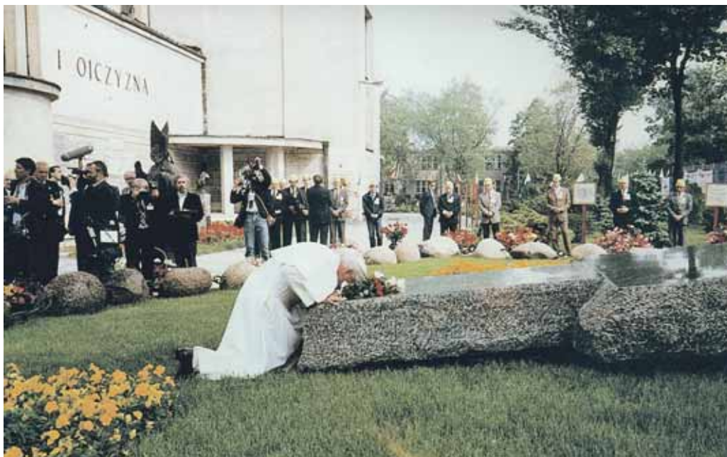
Ojciec Święty Jan Paweł II modlił się i ucałował grób Męczennika 14 czerwca 1987 roku

Mieszkał jako rezydent w parafii św. Stanisława Kostki na Żoliborzu w Warszawie. W sierpniu 1980 roku odprawił Mszę św. dla hutników z Warszawy, znajdując z nimi wspólny język. Od lutego 1982 roku w każdą ostatnią niedzielę miesiąca ks. Jerzy odprawił Msze św. w intencji Ojczyzny, które gromadziły tysiące wiernych. Głosił kazania, w których mówił o miłości Boga do człowieka, demaskował zło i bronił prześladowanych. Działalność ks. Jerzego Popiełuszki ówczesne władze PRL uznały za krytykę i sprzeciw wobec systemu komunistycznego. W czasie stanu wojennego ks. Jerzy był wielokrotnie oskarżany o zaangażowanie w działalność polityczną, wskutek czego stał się celem działań operacyjnych Służby Bezpieczeństwa.