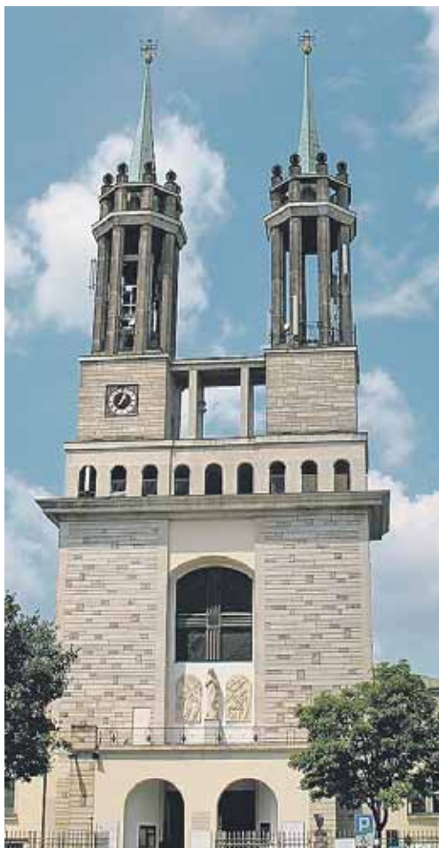
Kościół pw. Św. Stanisława Kostki w Warszawie, w którym ks. Jerzy odprawiał Msze św. za Ojczyznę

„19 października, przed dwoma laty zginął w wiadomych, straszliwych okolicznościach ksiądz Jerzy Popiełuszko, który tak bardzo kochał Kościół, swój Naród, jego wolność, jego